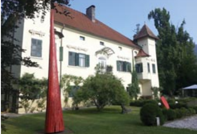
Galerija Walker v gradu Ebenau, Svetna vas

cerkvam. Možno je obiskati gradove in dvorce . Okrog starih kulturnih prostorov, nenavadnih skal, gorskih verig in vrelcev se ovijajo pripovedke in legende.