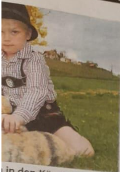
in den Kärntner Pfarren m Gottesdienstkalender ern2021 abrufbar.

WEIT/G., Stadtpfarrkirche: Grab- e der Trabentengarde, 10 - 13 Uhr. ODEN, Herz Jesu Kirche: Oster- ie, 21 Uhr; So., 4. 4.: Festgottes- t, 10 Uhr; Lieserhofen: So., 4. 4.: t, 5 Uhr; Lieseregg: Osterliturgie, ir; So., 4. 4.: Messe, 8.45 Uhr; 5. 4.: Messe, um 8.45 Uhr; Treff- Osterliturgie, 19 Uhr; So., 4. 4.: t, um 7.30 Uhr. AL/DRAU, Pfarrkirche: Oster- feier, 20.30 Uhr. SBERG, Stadtpfarre: Feuerseg- um 7.30 Uhr; Markuskirche: achtsfeier, um 20 Uhr.