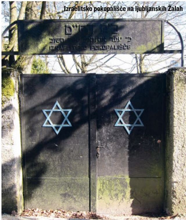
Izraelitsko pokopališče na ljubljanskih Žalah