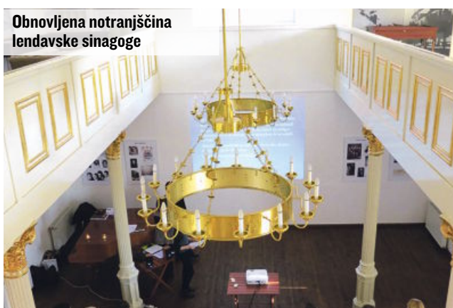
Obnovljena notranjščina lendavske sinagoge