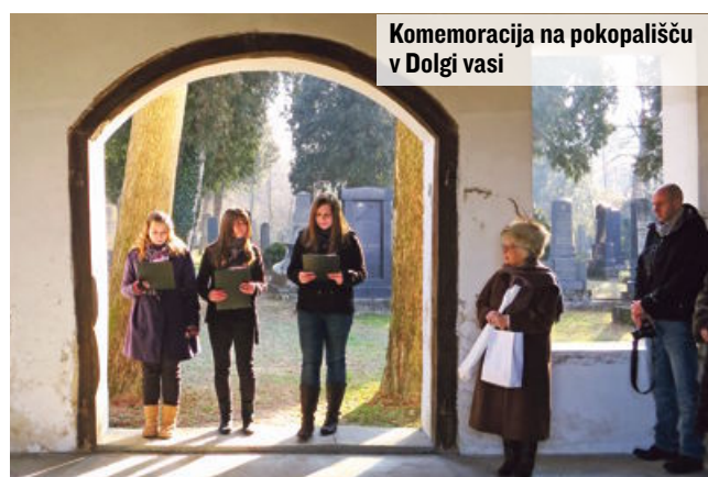
Komemoracija na pokopališču v Dolgi vasi