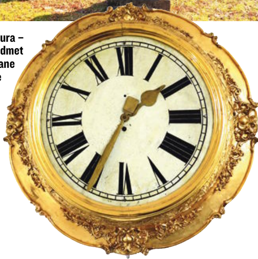
Stenska ura – edini predmet iz razdejane sinagoge